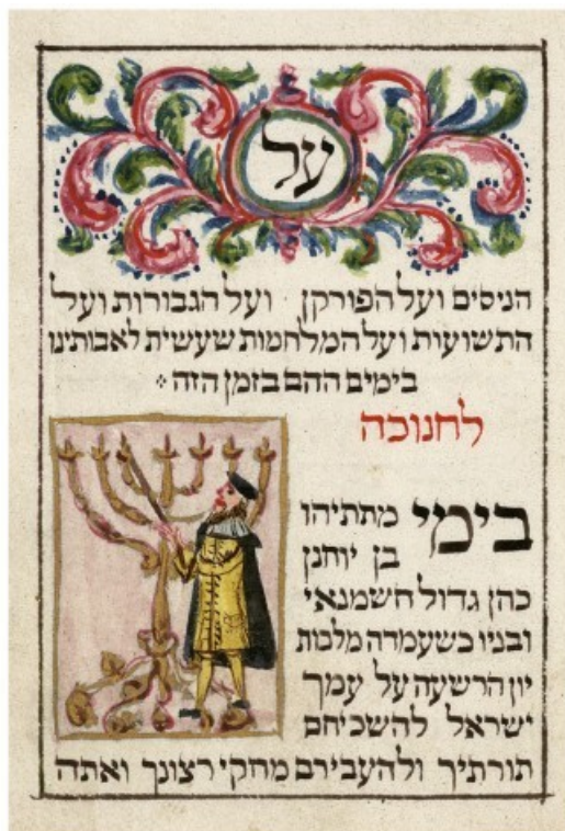
Chanuka. Fuerth, 1738. Manuscript op perkament

ik door Gods barmhartigheid jou en je broers terugkrijgen.' 30 Nauwelijks had ze dit gezegd, of de jongen riep uit: 'Waar wacht u op? Ik gehoorzaam het bevel van de koning niet, ik gehoorzaam het bevel van de wet die Mozes onze voorouders heeft gegeven.