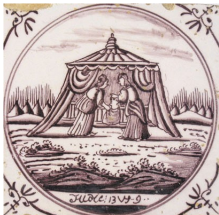
Judit steekt het hoofd van Holofernes in een zak

Ook de magistraten van Betulia zijn niet gelovig genoeg. Ze beloven het volk dat als JHWH de stad niet binnen vijf dagen ontzet, dat zij zich over zullen geven aan de belegeraars, zodat niet iedereen zal omkomen vanwege watertekort. Judit is sterker in haar betrouwen. Ze berispt de magistratuur. Een vrouw met lef. Vervolgens wendt zij zich in gebed tot de JHWH, neemt een bad, legt haar boetekleed af en trekt haar mooie kleding aan, die zij droeg toen haar man nog leefde. Vervolgens verlaat zij de stad en begeeft zich samen met haar kamenier naar het legerkamp waar Holofernes zich bevindt. Ze wendt voor dat ze hem hulde wil brengen.