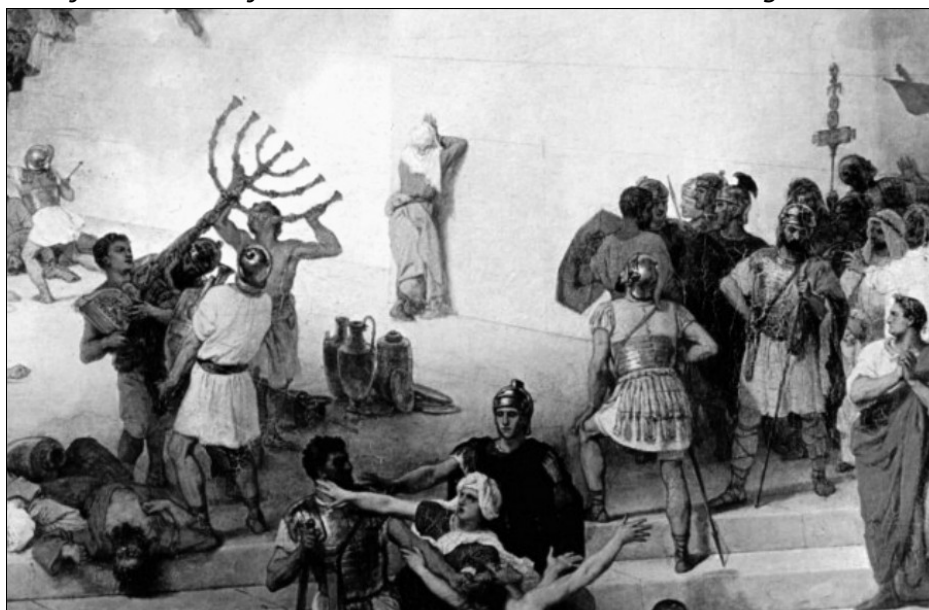
170 BC Antiochus IV took Jerusalem. The soldiers were ordered to kill anyone they met regardless of age or gender. In three days, 80,000 men were missing, dead or sold into slavery 2 Mac 5:11-14.

10 Daarna was de derde broer aan de beurt. Hij stak desgevraagd onmiddellijk zijn tong naar buiten, bood onverschrokken ook zijn handen aan 11 en zei fier: 'Uit de hemel heb ik ze gekregen, omwille van Gods voorschriften doe ik er afstand van, en van