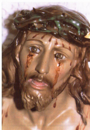
Mijn Jezus Barmhartigheid. Barmhartigheid mijn Jezus. O Jezus, uw Heilig Kostbaar Bloed kome ons en de arme zielen ter hulp.

Eeuwige Vader, schenk ons Barmhartigheid in naam van het Kostbaar Bloed van uw Enige Zoon, schenk ons Barmhartigheid, smeken wij U. Amen.