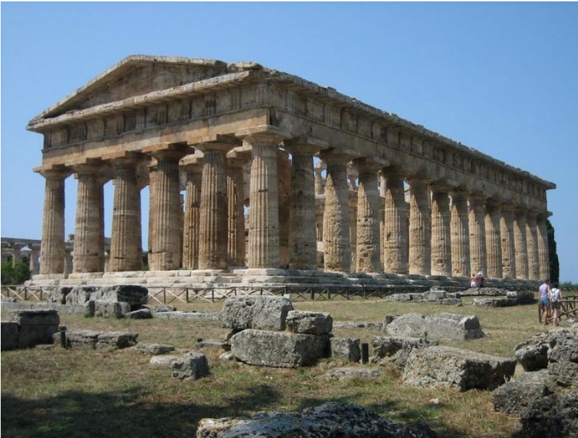
Tempel van Artemis 5 in Efese.