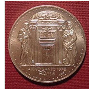
De H. Deur op een herdenkingsmunt uit 1975

slotritueel weer met even grote plechtigheid dichtgemetseld. Het was en is ook nu nog de paus, die met een speciale hamer tegen de deur tikt en zo het zegel verbreekt, dat aan het einde van het Heilig Jaar daarvoor is aangebracht. Daarop wordt de deur snel opengebroken. Tijdens de slotceremonie is het wederom de paus die de deur verzegelt en zo het Heilig Jaar beëindigt. Op andere bedevaartplaatsen en plaatsen waar de aflaat van het Heilig Jaar verkregen kon worden, kwamen Heilige Deuren voor. De meest bekende behoort tot de Dom in Santiago de Compostella, maar ook in Napels en in de vier kerken van Lissabon zijn dergelijke deuren te vinden.