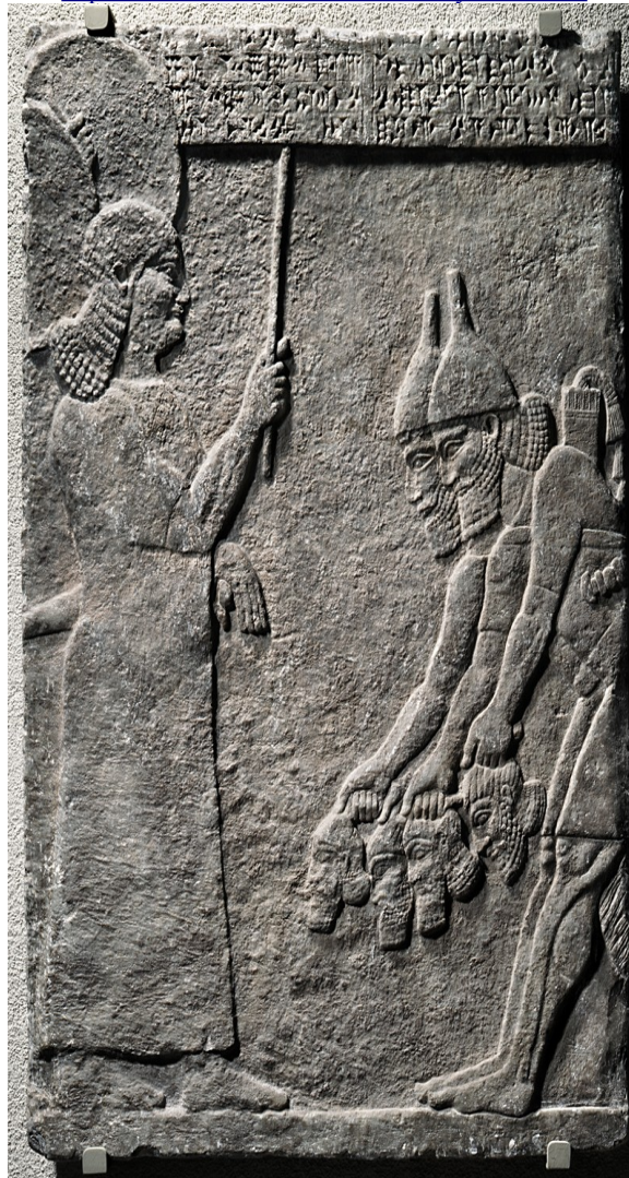
Tiglathpileser III onthoofding van eenuchen.

http://home-3.tiscali.nl/~meester7/assyrisch2.html